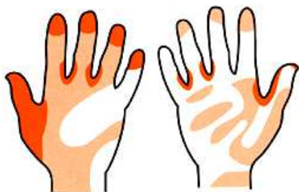
洗い残しの多い所