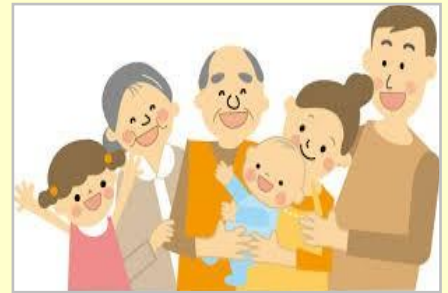
【子育て家族 イラスト】