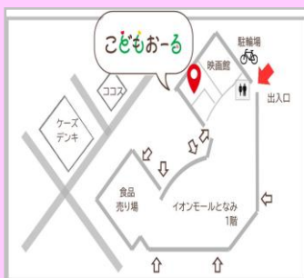
【イオンシネマのとなり】