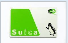
【ハイブリッド新型車両の外観と車内、交通系ICカードの一例】