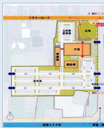
【エレガガーデン敷地での新庁舎配置予定図】