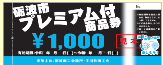
【令和7年度のプレミアム商品券】